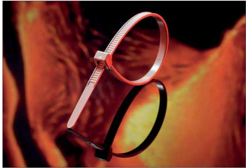
Das Design ermöglicht ein besonders leichtes Einschlaufen.

PEEK Ties wurden in Zusammenarbeit mit führenden Unternehmen für den Einsatz in extremer Umgebung entwickelt. Ihre Eignung für den Hochtemperaturbereich prädestiniert PEEK Ties für Anwendungen in den Industriezweigen Luftfahrt, Militär, Schienenfahrzeuge, Ölindustrie und Automobil. Die gute Strahlenbeständigkeit und chemische Resistenz ermöglicht Applikationen in der Medizintechnik und chemischen Industrie sowie in Kraftwerken. Als Kabelbinder mit besonderen Eigenschaften verbindet er die mechanischen Leistungsmerkmale und Beständigkeiten eines Metallkabelbinders mit der einfachen Installation eines Polyamidkabelbinders.