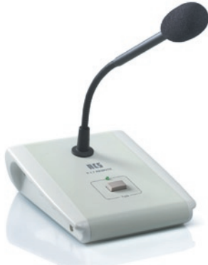
Mikrofon-Sprechstelle ..... VLM-100 A

Mikrofon-Sprechstelle (Kondensator) mit Vorgang und Prioritäts-Schaltung über 7-pol. DIN-Stecker.