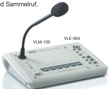
Mikrofon-Sprechstelle ..... VLM-105 Mikrofon-Sprechstelle .. VLM-105 WO wie VLM-105 jedoch ohne Schnittstelle RR-10 Funktionserweiterungsmodul .. VLE-004 zur Fernbedienung von Sonderfunktionen

Digitale Mikrofon-Sprechstelle zur Anwahl der 6 einzelnen Lautsprecherlinien. Vorgang und Sammelruf.