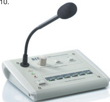
Mikrofon-Sprechstelle ..... VLM-205 Mikrofon-Sprechstelle .. VLM-205 WO wie VLM-205 jedoch ohne Schnittstelle RR-10

Digitale Mikrofon-Sprechstelle zur Anwahl der 5 einzelnen Lautsprecherkreise und zur Fernsteuerung des Digital-Textmoduls DM-10.