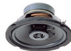
mit professionellem 2-Wege-Koaxial-Chassis

Dieses Koaxial-Lautsprecherchassis erfüllt auch professionelle Ansprüche im Bezug auf Schalldruck und Tonwiedergabe, die Belastbarkeit beträgt max. 40 W. Dazu sorgt ein hochwertiger Übertrager für beste Musik- und Sprachqualität.