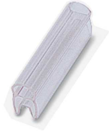
Abbildung zeigt die Variante PATG 0/15

http://eshop.phoenixcontact.de/phoenix/treeViewClick.do?UID=0808011