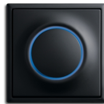
Schwarz matt (-775) mit Rahmen schwarz matt (-775)