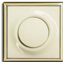
Elfenbein/weiß (-72) mit Rahmen solargold (-73)