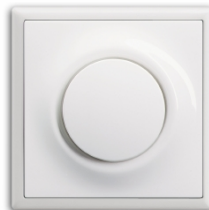
Alpinweiß matt (-774) mit Rahmen Alpinweiß matt (-774)