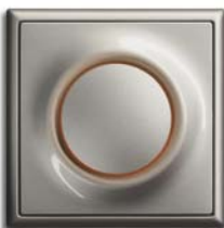
Champagner Metallic (-79) mit Rahmen schampagner metallic (-79)