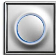
Alusilber (-783) mit Rahmen Chroma (-726)