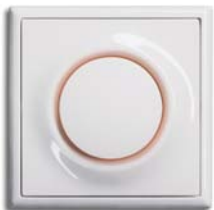
Alpinweiß (-74) mit Rahmen alpinweiß (-74)

Parallelhubtechnik im Gegensatz zu herkömmlichen Schaltern bietet der impuls einen höheren Bedienkomfort: Ein leichter Druck an jeder beliebigen Stelle des Betätigungsknopfs genügt, um den Schaltvorgang auszulösen. Durch die Gestaltung des sogenannten Umschaltpunkts von impuls spüren die Finger deutlich, dass geschaltet wurde.