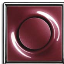
Brombeer (-777) mit Rahmen chroma (-726)