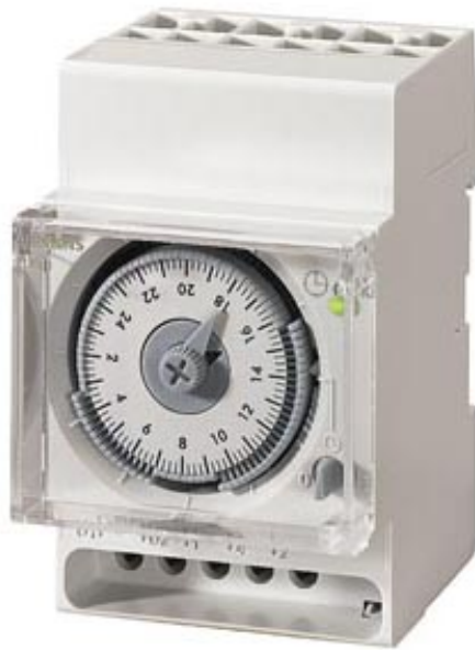
QUARZ-SCHALTUHR WOCHE 1WECHSLER 230V/50-60HZ 3TE AUTO.SO/WI UMSCHALTUNG