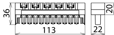
Maßbild BM 10 DRL

Steckmagazin (ohne Ableiter) zur Aufnahme von 1 bis max. 10 dreipoligen Gasentladungsableitern GDT 230 B3... . Ebenfalls geeignet zur Aufnahme von DRL-Schutzsteckern mit Erdungsrahmen.