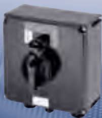
3-polig, 40 A