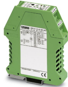
Abbildung zeigt die Variante MCR-S-1-5-UI-DCI

http://eshop.phoenixcontact.de/phoenix/treeViewClick.do?UID=2814715