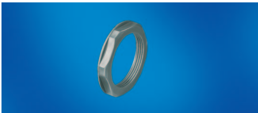
Kabelverschraubungen und Zubehör