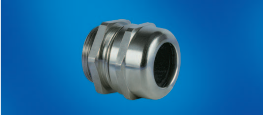
Kabelverschraubungen und Zubehör