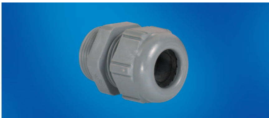
Kabelverschraubungen und Zubehör