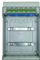
integrierte Steckklemmtechnik für PE und N