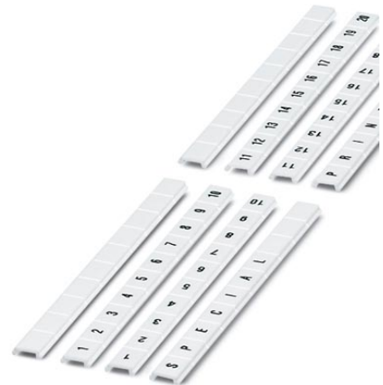
Abbildung zeigt die Varianten ZBF 8- UNBEDRUCKT, -LGS:FORTL.ZAHLEN, -QR:FORTL.ZAHLEN und -SO/CMS

http://eshop.phoenixcontact.de/phoenix/treeViewClick.do?UID=0808781