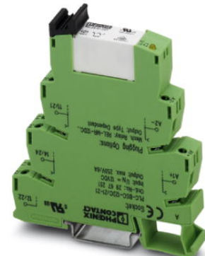
Abbildung zeigt die Variante PLC-RSC- 24DC/21-21

http://eshop.phoenixcontact.de/phoenix/treeViewClick.do?UID=2967099