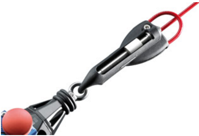
Produkt im Umfeld