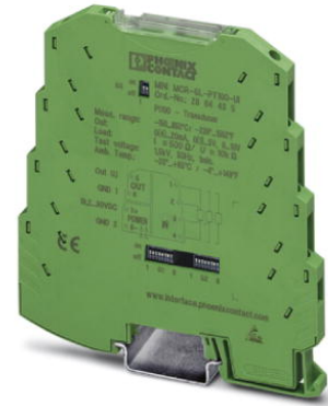
Abbildung zeigt die Variante mit Schraubanschluss

http://eshop.phoenixcontact.de/phoenix/treeViewClick.do?UID=2864273