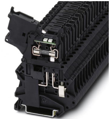
Abbildung zeigt die Variante UT 4-HESILED 24

http://eshop.phoenixcontact.de/phoenix/treeViewClick.do?UID=3046100