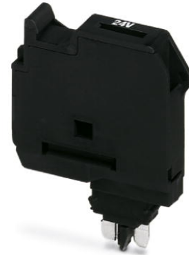
Abbildung zeigt die Variante ohne Leuchtanzeige

http://eshop.phoenixcontact.de/phoenix/treeViewClick.do?UID=3036819