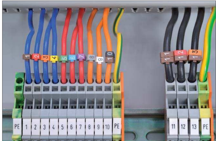
WIC-Markierer eignen sich besonders für die Kennzeichnung nach der Montage.

Dieser praktische Clip wird besonders im Maschinenbau sowie im Schaltschrank- und Anlagenbau eingesetzt.