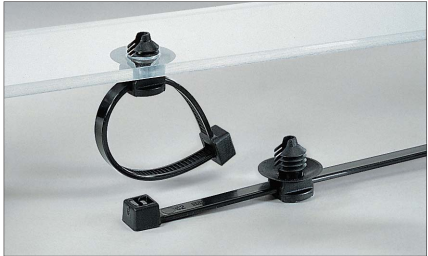
Der Lamellenfuß ist auch in Sacklochbohrungen verwendbar.

Durch das verschiebbare Fußteil auf dem Kabelband kann der Kopf sowohl während der Montage als auch für den Einbau in die optimale Position gedreht werden.