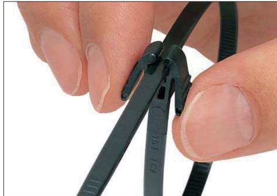
Der REZ-Kabelbinder lässt sich einfach wieder öffnen.

Die REZ-Kabelbinder sind überall dort geeignet, wo ein einfaches und schnelles Wiederöffnen wichtig ist, z. B. bei der Vormontage in der Kabelkonfektion.