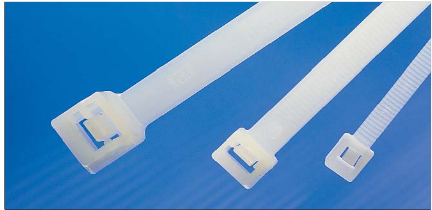
Die Kabelbinder der RT-, RELK- und RLT-Serie sind lösbar und daher wiederverwendbar.

RT-Kabelbinder werden für alle Arten von Bündelungen insbesondere bei der Kabelvorkonfektion eingesetzt.