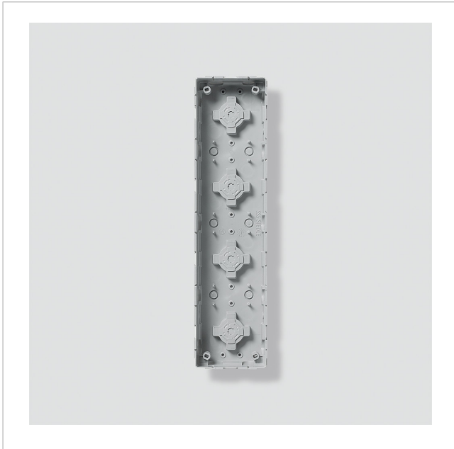
Unterputzgehäuse GU 611-4/1-0