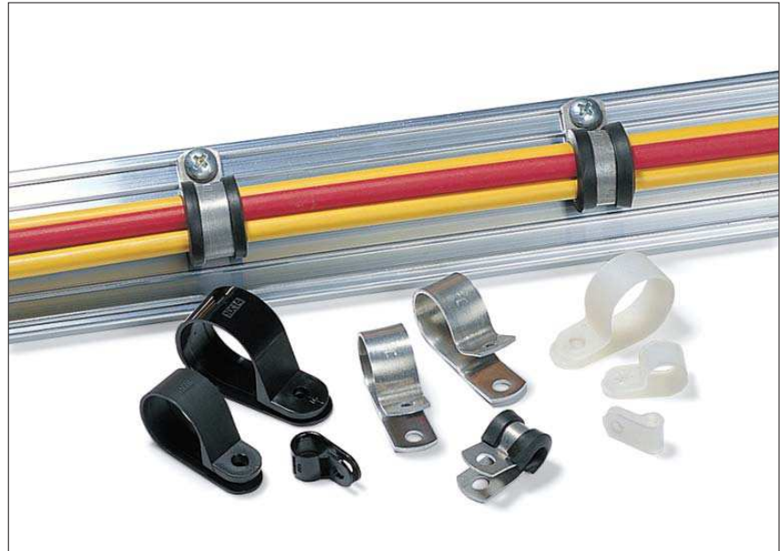
Die Befestigungsschellen sind in unterschiedlichen Ausführungen erhältlich.

Neben der Rohrbefestigung (z. B. im Wohnwagenbau) werden auch Leitungen oder Bauelemente (z. B. Kondensatoren) mit den Alu-Schellen befestigt.