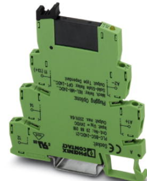
Abbildung zeigt die Variante PLC-BSC- 24DC/21

http://eshop.phoenixcontact.de/phoenix/treeViewClick.do?UID=2966634