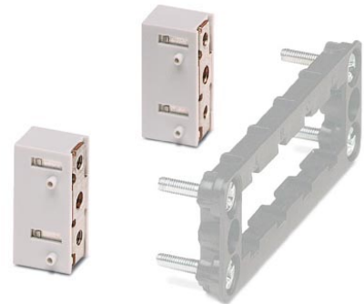
Abbildung zeigt den Anbauflansch mit Anbaurahmen VC-AR1/2M

http://eshop.phoenixcontact.de/phoenix/treeViewClick.do?UID=1852862