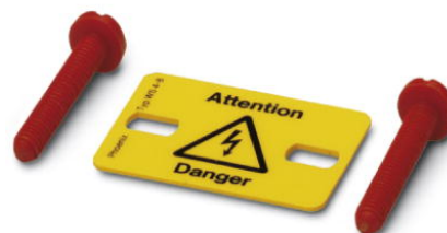
Abbildung zeigt die Variante WS 4- 8

http://eshop.phoenixcontact.de/phoenix/treeViewClick.do?UID=0805344