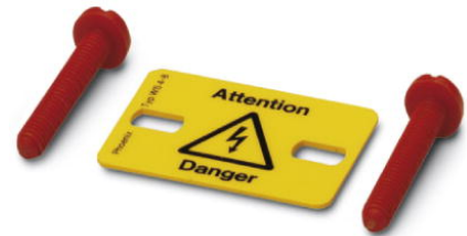
Abbildung zeigt die Variante WS 4- 8

http://eshop.phoenixcontact.de/phoenix/treeViewClick.do?UID=0805331