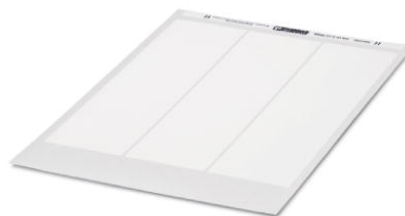
Abbildung zeigt Variante des Artikels

http://eshop.phoenixcontact.de/phoenix/treeViewClick.do?UID=5032400