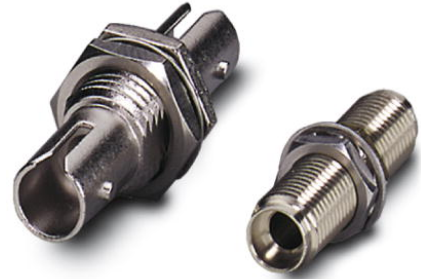
Abbildung zeigt die Varianten PSM-SET-BFOC-LINK/2 und PSM-SET-FSMA-LINK/2

http://eshop.phoenixcontact.de/phoenix/treeViewClick.do?UID=2799416