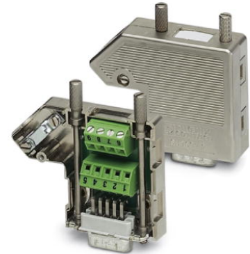
Abbildung zeigt die Variante SUBCON 9/M-SH

http://eshop.phoenixcontact.de/phoenix/treeViewClick.do?UID=2761622