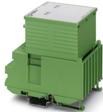
Abbildung zeigt die Variante IBS ST 24 BK-LK

http://eshop.phoenixcontact.de/phoenix/treeViewClick.do?UID=2754341