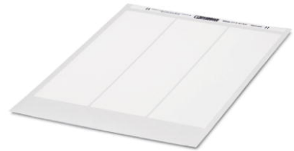
Abbildung zeigt Variante des Artikels

http://eshop.phoenixcontact.de/phoenix/treeViewClick.do?UID=0803663