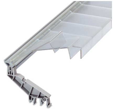
Abbildung zeigt eine Kombination aus den Varianten APK 1, APK-HP und APK -TU

http://eshop.phoenixcontact.de/phoenix/treeViewClick.do?UID=5022795