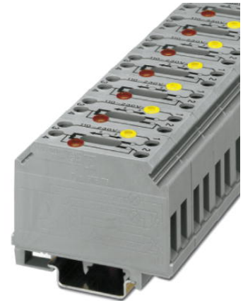
Abbildung zeigt die Variante GTF 76/230

http://eshop.phoenixcontact.de/phoenix/treeViewClick.do?UID=3121025