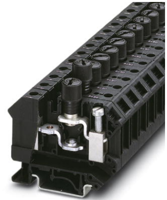
Abbildung zeigt die Variante UK 10-DREHSI (5x20)

http://eshop.phoenixcontact.de/phoenix/treeViewClick.do?UID=3005507