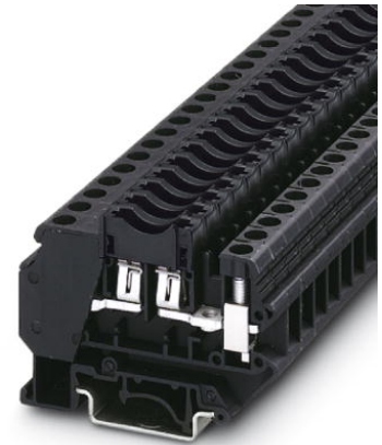
Abbildung zeigt die Variante UK 6-FSI/C

http://eshop.phoenixcontact.de/phoenix/treeViewClick.do?UID=3001938