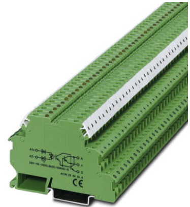
Abbildung zeigt die Variante DEK-OE- 24DC/24DC/100KHZ-G

http://eshop.phoenixcontact.de/phoenix/treeViewClick.do?UID=2964348