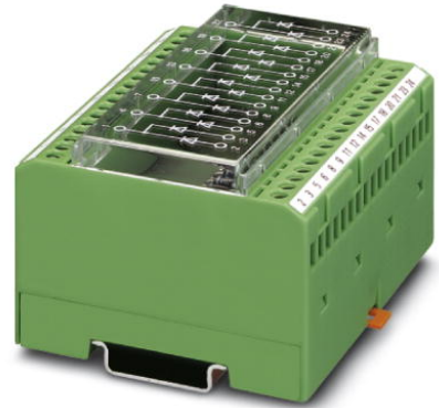
Abbildung zeigt die Variante EMG 90-DIO 16 E/LP

http://eshop.phoenixcontact.de/phoenix/treeViewClick.do?UID=2954785