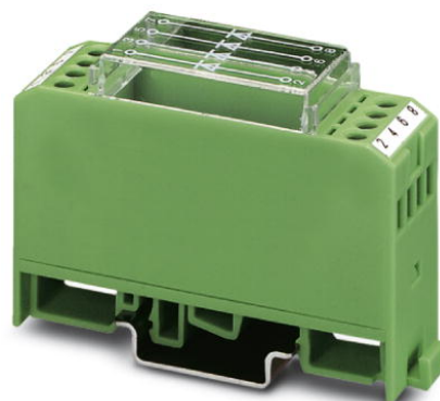
Abbildung zeigt die Variante EMG 22-DIO 4E

http://eshop.phoenixcontact.de/phoenix/treeViewClick.do?UID=2952790