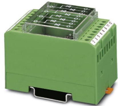
Abbildung zeigt die Variante EMG 45-DIO 8 E/LP

http://eshop.phoenixcontact.de/phoenix/treeViewClick.do?UID=2950132