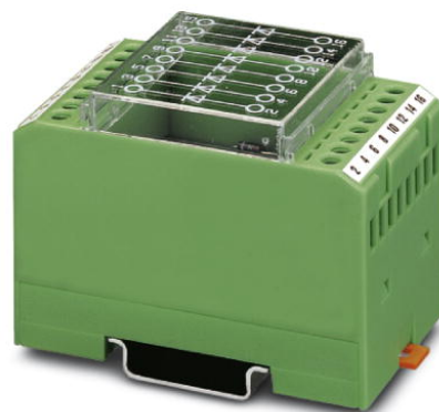
Abbildung zeigt die Variante EMG 45-DIO 8E

http://eshop.phoenixcontact.de/phoenix/treeViewClick.do?UID=2949389