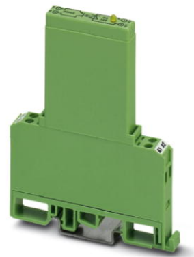
Abbildung zeigt die Variante EMG 10-OE, mit Gleichspannungs-Ausgang, max.100 mA

http://eshop.phoenixcontact.de/phoenix/treeViewClick.do?UID=2948908