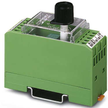
Abbildung zeigt die Variante EMG 30-SP- 1K LIN

http://eshop.phoenixcontact.de/phoenix/treeViewClick.do?UID=2942124