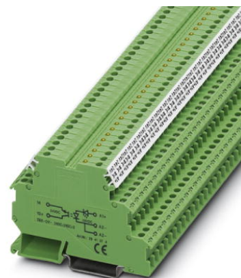
Abbildung zeigt die Variante DEK-OV- 24DC/24DC/3

http://eshop.phoenixcontact.de/phoenix/treeViewClick.do?UID=2941387