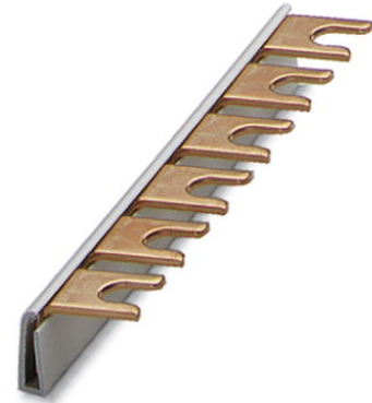
Abbildung zeigt die Variante MPB 18/1-6

http://eshop.phoenixcontact.de/phoenix/treeViewClick.do?UID=2809225