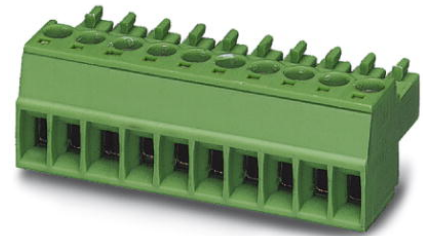
Abbildung zeigt eine 10-polige Variante des Artikels

http://eshop.phoenixcontact.de/phoenix/treeViewClick.do?UID=1840405