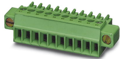
Abbildung zeigt eine 10-polige Variante des Artikels

http://eshop.phoenixcontact.de/phoenix/treeViewClick.do?UID=1827761