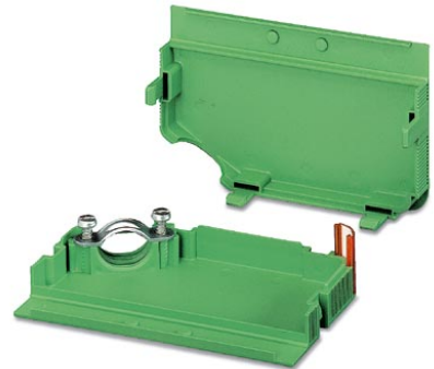
Abbildung zeigt eine 8-polige Variante

http://eshop.phoenixcontact.de/phoenix/treeViewClick.do?UID=1805592